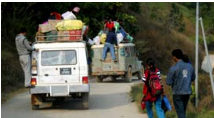
Det som inte får plats inne i bilen får plats utanpå.