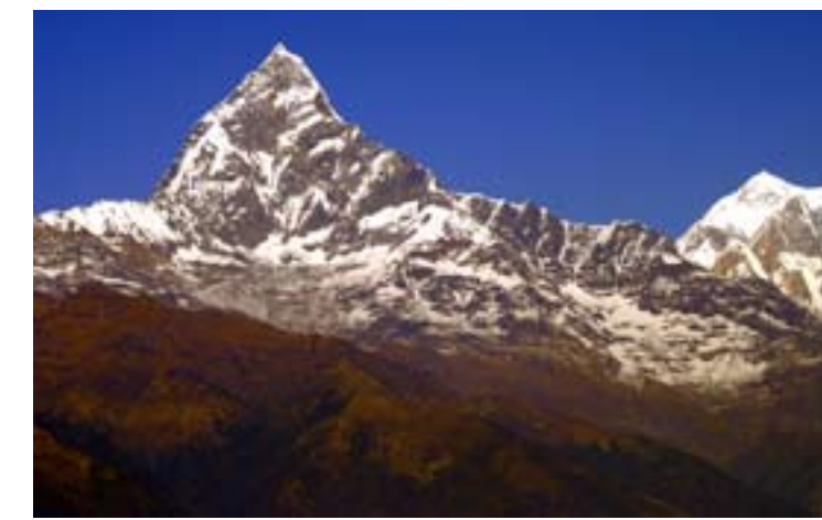
Macchapuchre, en av de mest kända nepalesiska topparna vid sidan av Mt Everest, tronar majestätiskt över Pokhara-dalen.