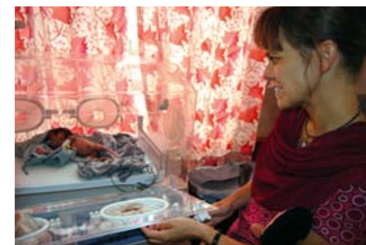
Nepal har en hög barnadödlighet, men vid Tansensjukhuset får även för tidigt födda barnen chansen att klara de första kritiska dagarna och veckorna i livet.