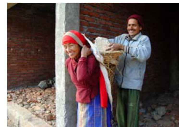
Tunga bördor hindrar inte nepaleserna från att le mot fotografen.