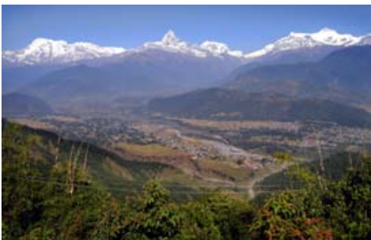
Utsikten över Pokharadalen går inte av för hackor!