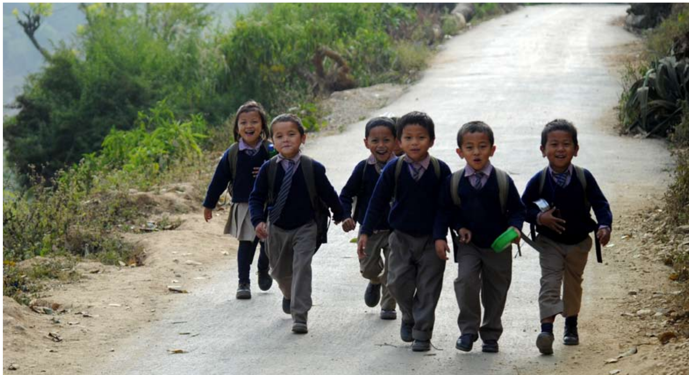
Skolbarn har ofta lång väg att gå för att ta sig hem från skolan.