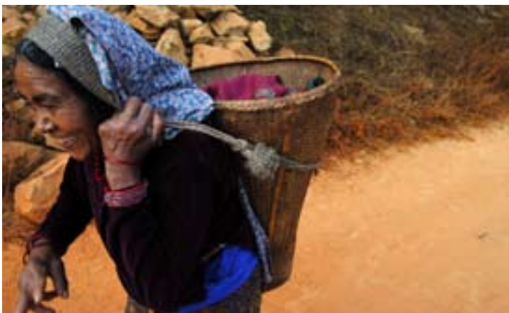
"Jag är på väg in till marknaden för att köpa olja", berättar kvinnan, snart framme efter att ha vandrat i två timmar från hembyn utanför Tansen.