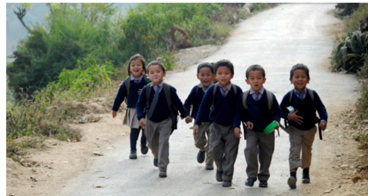
Skolbarn har ofta lång väg att gå för att ta sig hem från skolan.