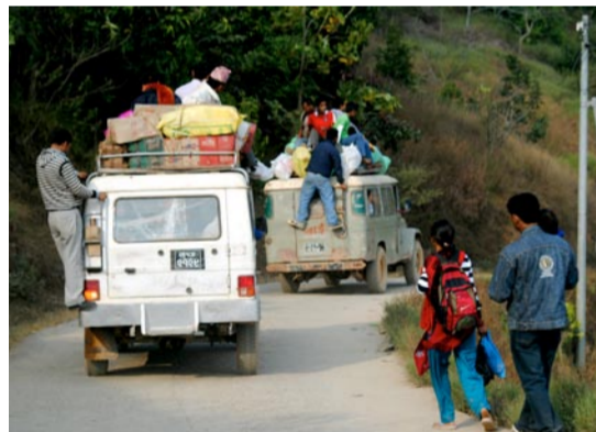
Det som inte får plats inne i bilen får plats utanpå.