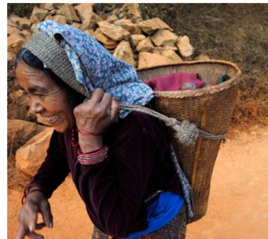
"Jag är på väg in till marknaden för att köpa olja", berättar denna kvinna, snart framme efter att ha vandrat i två timmar från hembyn utanför Tansen.

Hon kunde sedan ge sig i kast med sitt stora projekt, att utforma en barnsjuksköterskeutbildning anpassad till de lokala förhållandena. Under två månaders inten-