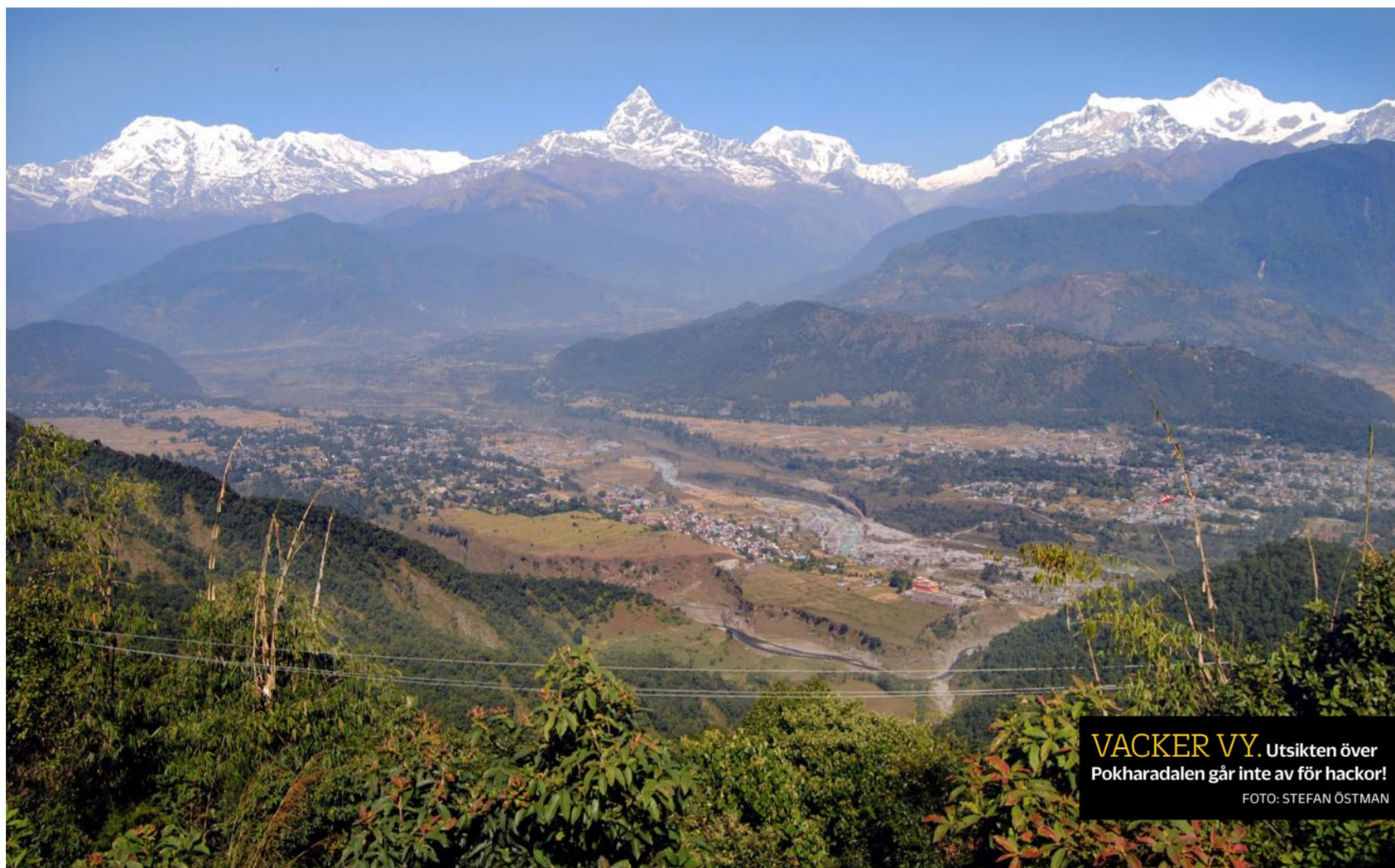
VACKER VY. Utsikten över Pokharadalen går inte av för hackor!